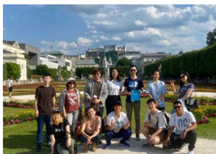
Tagesausflug nach Salzburg