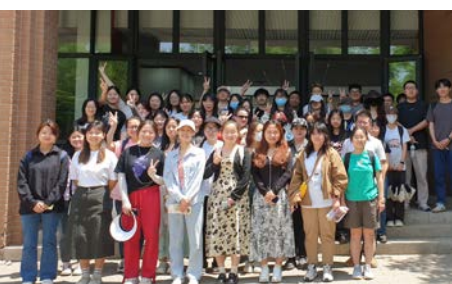
Tianjin Sino-German University of Applied Sciences