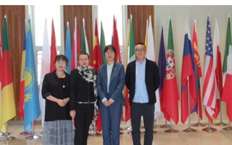
Jilin International Studies University, Changchun