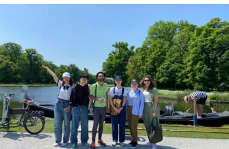
Nicht in Venedig, ... sondern im Schlosspark Nymphenburg