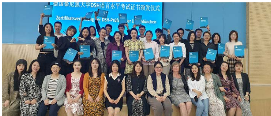
Studierende in Qingdao mit ihrem DSH-Zertifikat an der UPC

Ergänzend zur DSH in München bieten die Deutschkurse an der Partneruniversität UPC (China University of Petroleum) in Qingdao seit 2016 auch eine Fern-DSH an. Es ist eine der wenigen DSH-Prüfungen im Ausland. Im Mai 2023 konnten erstmals seit vier Jahren wieder Studieninteressierte vor Ort geprüft werden.