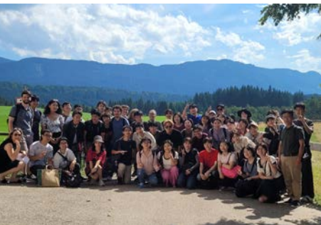
Exkursion nach Schloss Linderhof und zur Wieskirche