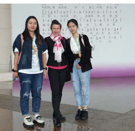
Zhejiang University, Hangzhou