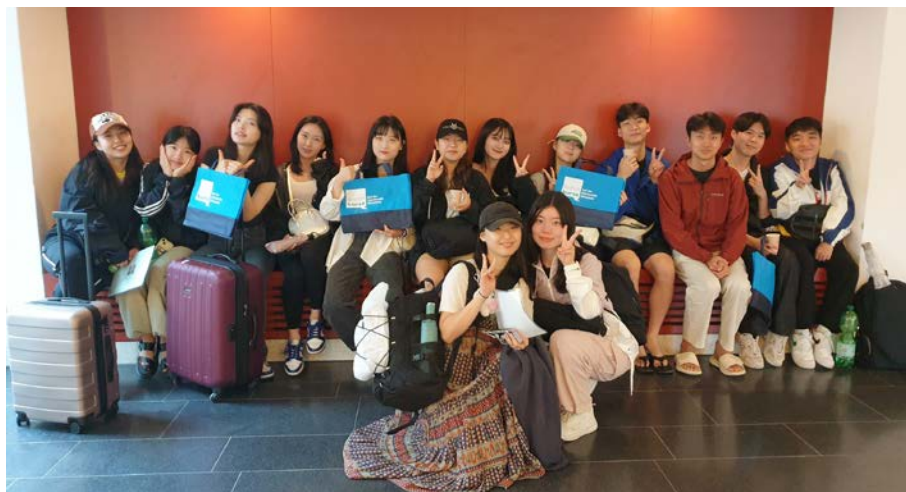
Studierende aus Korea bei der „Welcome Reception“