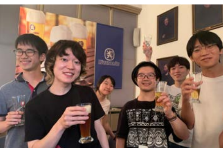
... mit Bier-Verkostung