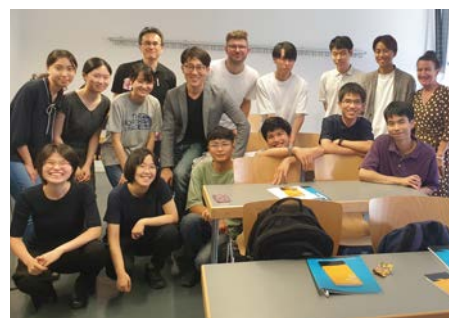
Studierende der University of Tokyo (Todai) aus Japan am ersten Kurstag