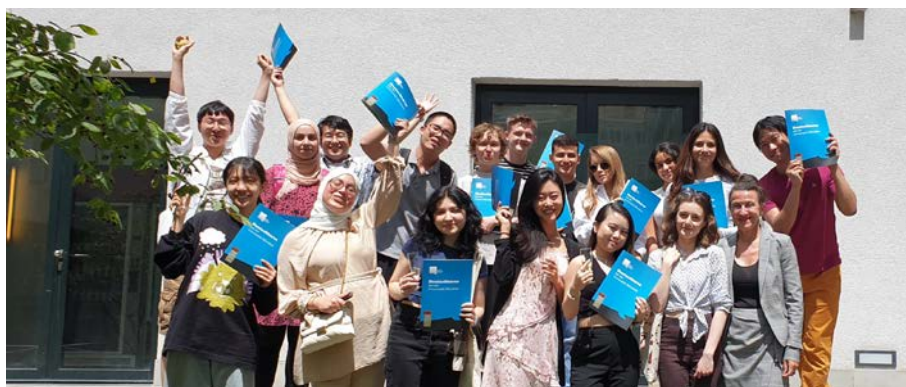
Das Zertifikat in der Hand: Glückliche Absolventinnen und Absolventen der DSH freuen sich auf ihr Studium in Deutschland.

Viele internationale Studieninteressierte haben ein großes Ziel: Sie wollen die Deutsche Sprachprüfung für den Hochschulzugang (DSH) bestehen, um in Deutschland zu studieren oder eine berufliche Karriere zu starten. Die Prüfung ist anspruchsvoll und erfordert einiges an Lerndisziplin. Doch es lohnt sich: Die DSH öffnet die Tür zu Studium und Beruf. Neun Mal pro Jahr führt das Institut die DSH im Auftrag der Ludwig-Maximilians-Universität München durch.