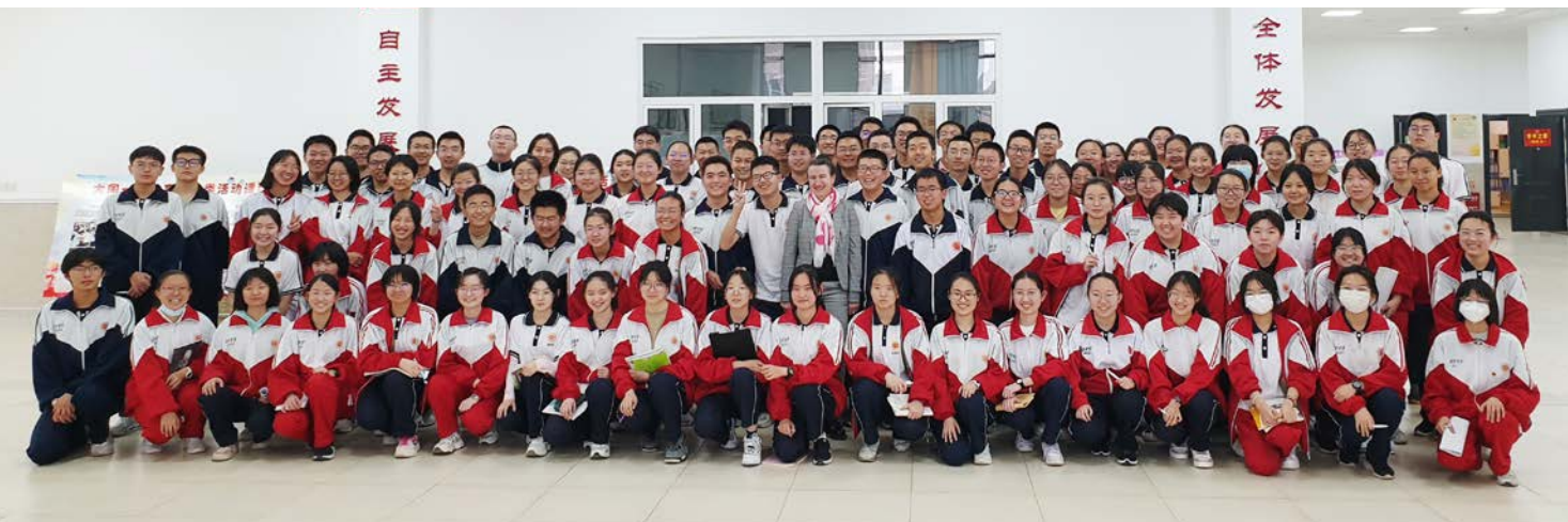
Die erste Deutschstunde für die Schüler/innen der Datong No. 1 High School