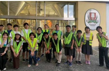
Besuch einer Münchener Brauerei

Die Studierenden kamen aus der ganzen Welt nach München. Vor allem bei japanischen und koreanischen Studieninteressierten war die Nachfrage groß.